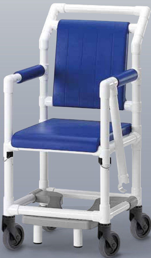
TC 450 K